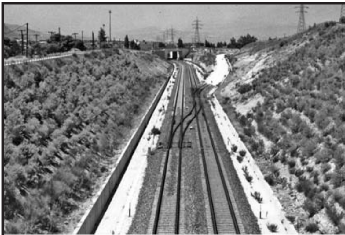
Στη φωτογραφία φαίνεται πεντακάθαρα η χάραξη της διακλάδωσης προς Λουτράκι των σιδηροδρομικών γραμμών του Προαστιακού στη θέση Παράδεισος. ΕΙΝΑΙ ΑΛΗΘΕΙΑ Ή ΨΕΜΜΑΤΑ;

Μετά από κάποια σύσκεψη που προκάλεσε ο υπουργός