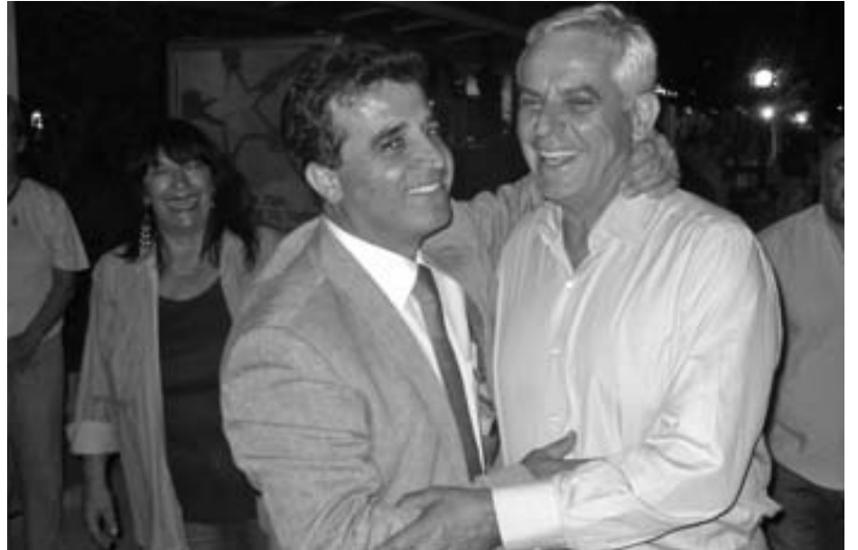
ΣΕ ΘΥΜΑΜΑΙ να αγωνίζεσαι πάντα με Ανδρέα, με Σημίτη, και σήμερα δίπλα στον Πρόεδρο μας Γιώργο Παπανδρέου με λεβεντιά και ανιδιοτέλεια!!!!