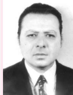
Γράφει ο Δρ Αναστάσιος Μητσόπουλος

Οδοντίατρος τ. Επιμελητής της Οδοντιατρικής Σχολής Πανεπιστημίου Αθηνών τ. Καθηγητής Τ.Ε.Ι Αθηνών, τ. Διευθυντής του Οδοντιατρικού Τμήματος του Γενικού Νοσοκομείου Νίκαιας-Πειραιώς «ΑΓΙΟΣ ΠΑΝΤΕΛΕΗΜΟΝ».