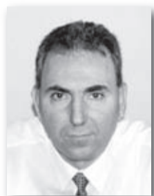
Του πολιτευτή της Ν.Δ. Στέλιου Μάρκελλου

Πολιτικός εκφραστής της σύνεσης. Του μέτρου. Της μετριοπαθείας! Πνεύμα ανήσυχο και καινοτόμο. Γνήσιος δημοκράτης. Επεδίωκε σταθερά τον διάλογο, τη συνεννόηση και τη συναίνεση στα μείζονα θέματα. Αυτός ήταν άλλωστε και ο λόγος, για τον οποίο συνειδητά ο Γεώργιος Ράλλης, ως πρωθυπουργός, επέλεξε να επενδύσει στην εμπέδωση ενός νέου πολιτικού πολιτισμού. Σε ώρες, που οι πολιτικοί του αντίπαλοι προέτασαν την οξύτητα. Την πόλωση, το λαϊκισμό. Ο Γεώργιος Ράλλης αποτέλεσε υπόδειγμα πολιτικού ανδρός. Σημαντική πολιτική προσωπικότητα. Συνέβαλε καθοριστικά στη διαμόρφωση μιας ομαλής μεταπολιτευτικής πολιτικής. Έβλεπε πάντοτε το εθνικό συμφέρον και όχι το προσωπικό του. Δίδαξε πολιτικό πολιτισμό. Παρά τις πολιτικές διαφορές που υπήρξαν, ακόμα και η Αριστερά έχει εκτιμήσει έμπρακτα την ειλικρίνεια του.