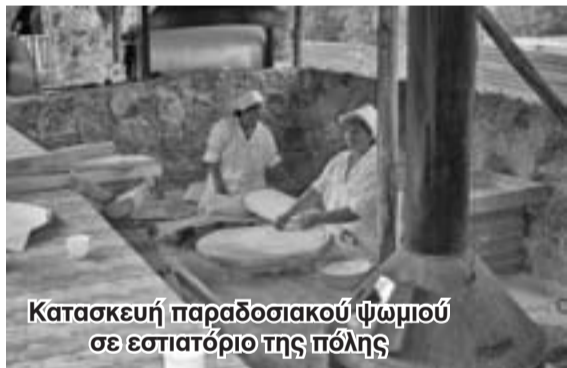
Κατασκευή παραδοσιακού ψωμιού σε εστιατόριο της πόλης