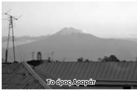
Το όρος Αραράτ