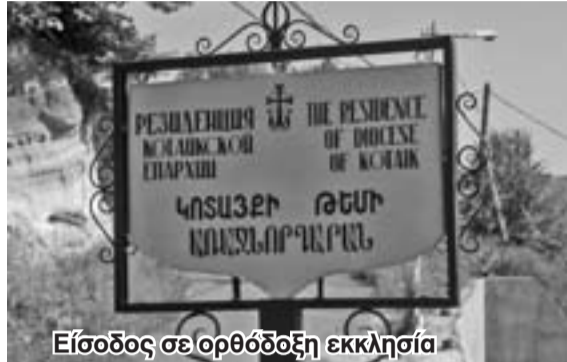
Είσοδος σε ορθόδοξη εκκλησία