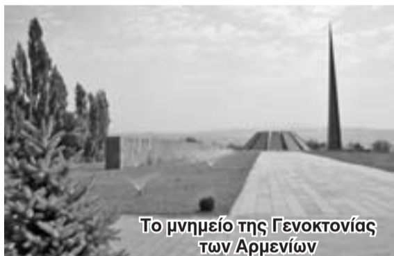
Το μνημείο της Γενοκτονίας των Αρμενίων