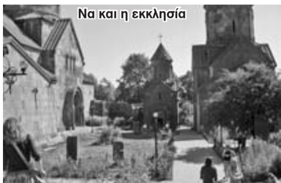
Να και η εκκλησία