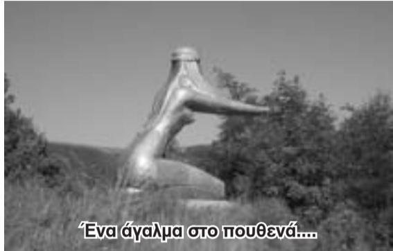
Ένα άγαλμα στο πουθενά...