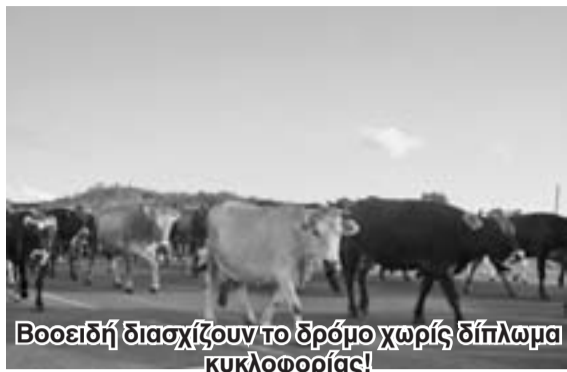
Βοοειδή διασχίζουν το δρόμο χωρίς δίπλωμα κυκλοφορίας!