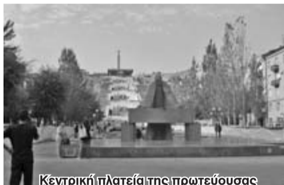
Κεντρική πλατεία της πρωτεύουσας Ερεβάν